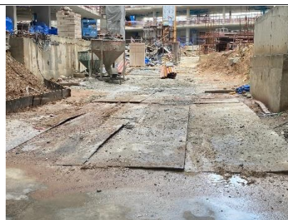
รูปที่ ผ7.12 แผ่นเหล็ก