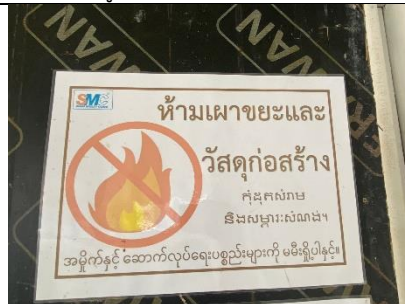
รูปที่ ผ7.14 ป้ายห้ามไม่ให้ผู้รับเหมาเผาทำลายวัสดุมูลฝอย