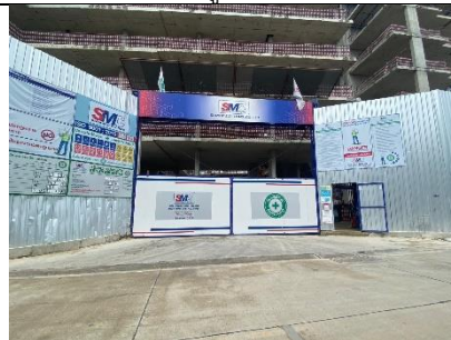
รูปที่ ผ7.16 ประตูทางเข้า-ออก ปิดทึบตลอดเวลา