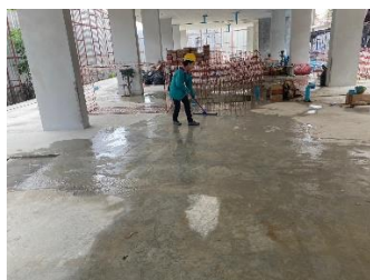
รูปที่ ผ7.11 พนักงานทำความสะอาดพื้นหลังการก่อสร้าง