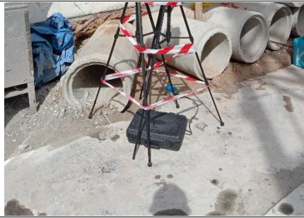
รูปที่ ๗.๖๑ การตรวจวัดความสั่นสะเทือน บริเวณพื้นที่โครงการ

ภาพถ่ายผลการปฏิบัติตามมาตรการป้องกันและแก้ไขผลกระทบสิ่งแวดล้อม และมาตรการติดตามตรวจสอบคุณภาพสิ่งแวดล้อม โครงการ ออริจิน เพลย์ ระยอง (ORIGIN PLAY RAYONG) ประจำเดือนกรกฎาคม-ธันวาคม 2566