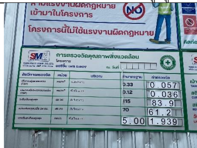
รูปที่ ผ7.20 ป้ายแสดงผลการตรวจวัดคุณภาพสิ่งแวดล้อม