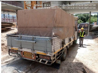
รูปที่ ผ7.15 ผ้าใบคลุมรถบรรทุก