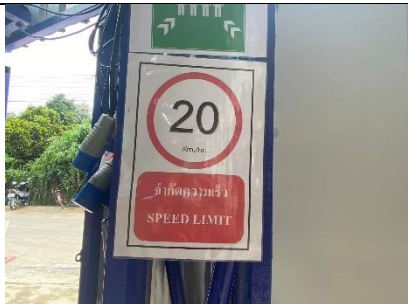
รูปที่ ผ7.13 ป้ายจำกัดความเร็วไม่เกิน 20 กิโลเมตร/ชั่วโมง