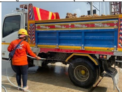
รูปที่ ผ7.17 เจ้าหน้าที่ล้างล้อรถบรรทุก