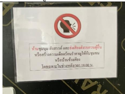
รูปที่ ผ7.18 ป้ายห้ามส่งเสียงดังรบกวนผู้อยู่อาศัยข้างเคียง